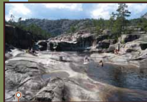
jettegrytter in Nissedal

Nissedal ligt helemaal in het zuiden van de provincie Telemark. De buurdorpen zijn: Fyresdal, Kviteseid, Drangedal, Gjerstad en Åmli. Allemaal plaatsen met uitgestrekte gebieden ongerepte natuur.